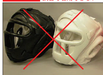
①ロータスクラブ製 KEN スポーツ製 面付きヘッドガード