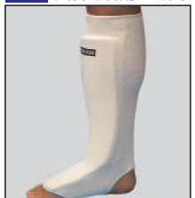
①ロータスクラブ製 サポーターレッグ