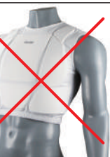
③イサミ製 インナーベスト