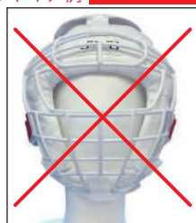
②マーシャルワールド製 イサミ製 面付きヘッドギア