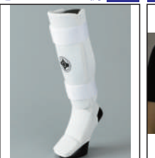
②グラチャン指定 足サポーター