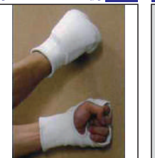
②KEN スポーツ製 拳サポーター