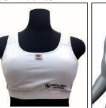
②グラチャン指定 チェストガード