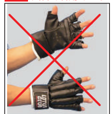
①ロータスクラブ製 各種グローブ