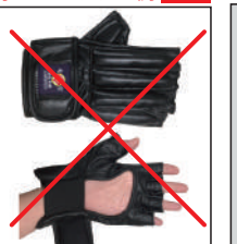
②グラチャン指定 グローブ