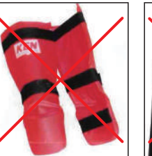
②KEN スポーツ製 レッグパッド