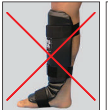
①ロータスクラブ製 レザーレッグ