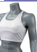
③イサミ製 イサミスポーツブラ