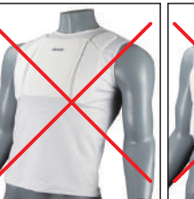
②イサミ製 インナーチェスト