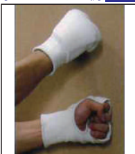
②KEN スポーツ製拳サポーター