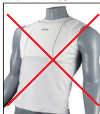
②イサミ製インナーチェスト