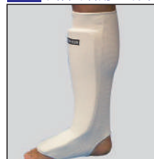
①ロータスクラブ製サポーターレッグ