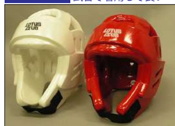
①ロータスクラブ製ウレタンヘッドガード