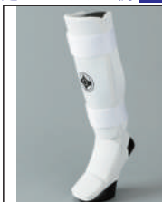
②グラチャン指定足サポーター