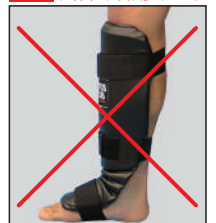
①ロータスクラブ製レザーレッグ