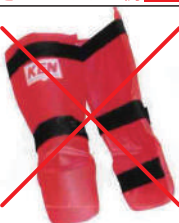
②KEN スポーツ製レッグパッド