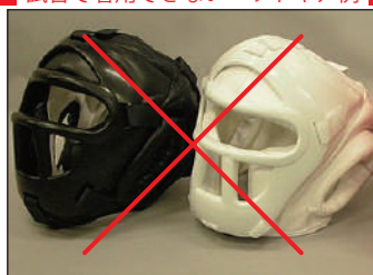
②ロータスクラブ製KEN スポーツ製面付きヘッドガード