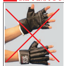
①ロータスクラブ製各種グローブ