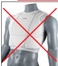
③イサミ製インナーベスト