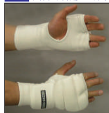
①ロータスクラブ製拳サポーター