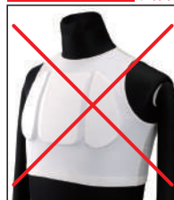
①リアルチャンピオン指定チェストプロテクター