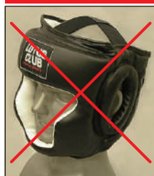
①ロータスクラブ製KEN スポーツ製レザー製ヘッドギア