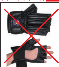
②グラチャン指定グローブ