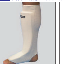
①ロータスクラブ製 サポーターレッグ