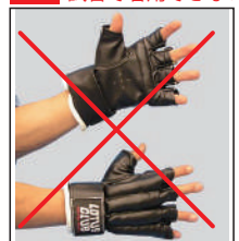
①ロータスクラブ製 各種グローブ