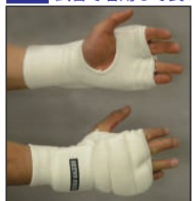
①ロータスクラブ製 拳サポーター