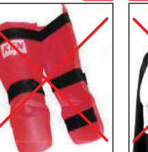
②KEN スポーツ製 レッグパッド