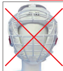
②マーシャルワールド製 イサミ製 面付きヘッドギア