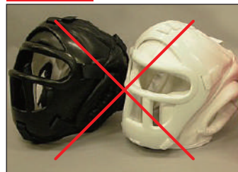
①ロータスクラブ製 KEN スポーツ製 面付きヘッドガード