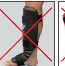
①ロータスクラブ製 レザーレッグ