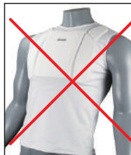
②イサミ製 インナーチェスト