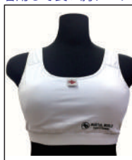
②グラチャン指定 チェストガード