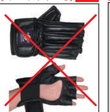
②グラチャン指定 グローブ