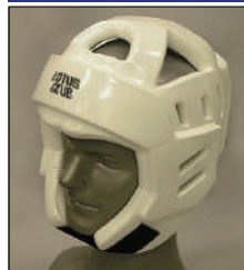
①ロータスクラブ製 ウレタンヘッドガード