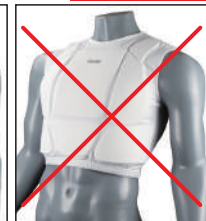
③イサミ製 インナーベスト