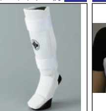
②グラチャン指定 足サポーター