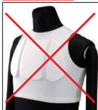
①リアルチャンピオン 指定チェストプロテクター