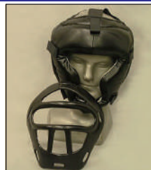
④各メーカーの 面付きヘッドギアも 面を外せば使用可能