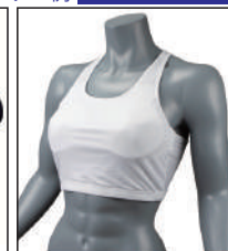
③イサミ製 イサミスポーツブラ