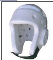
②KEN スポーツ製 ウレタンヘッドギア