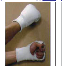
②KEN スポーツ製 拳サポーター