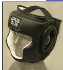
③ロータスクラブ製 KEN スポーツ製 レザー製ヘッドギア