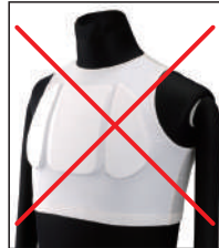
①リアルチャンピオン指定チェストプロテクター