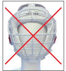
②マーシャルワールド製イサミ製面付きヘッドギア