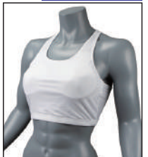
③イサミ製イサミスポーツブラ