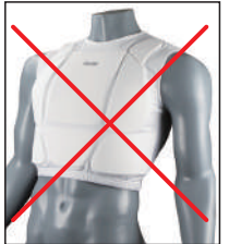
③イサミ製インナーベスト