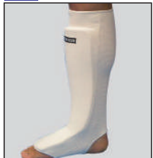
①ロータスクラブ製サポーターレッグ