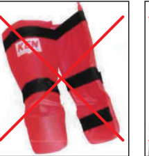
②KEN スポーツ製レッグパッド