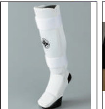
②グラチャン指定足サポーター