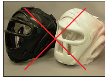
①ロータスクラブ製KEN スポーツ製面付きヘッドガード