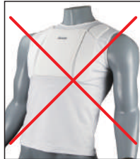
②イサミ製インナーチェスト