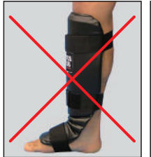
①ロータスクラブ製レザーレッグ