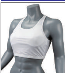
③イサミ製 イサミスポーツブラ