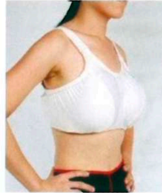
KENスポーツ製 ⑤胸ガード