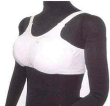
マーシャルワールド製