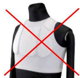
マーシャルワールド製